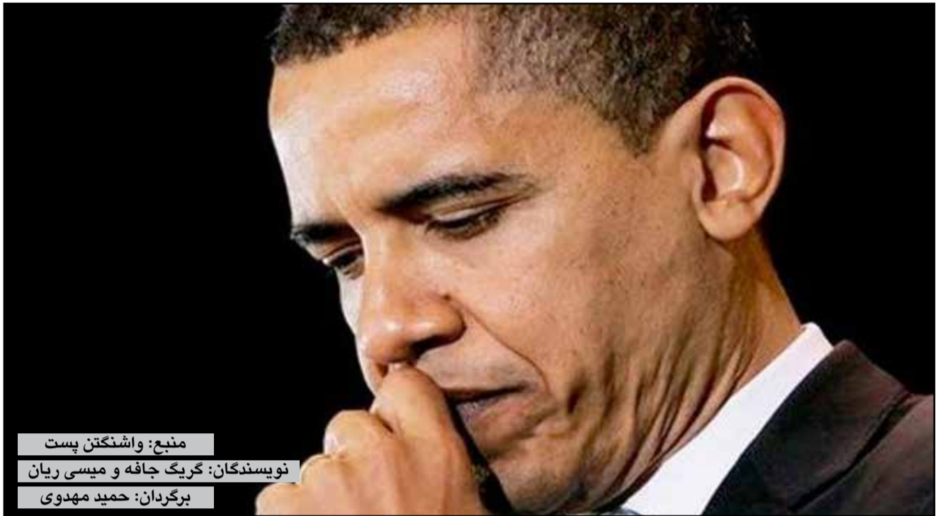
منبع: واشنگتن پست نویسندگان: کریک جافه و میسی ریان برگردان: حمید مهدوی