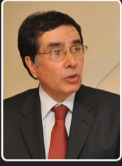
دوکتور ضیا نظام سفير اسبق افغانستان در وينا، بروکسيل و ژن