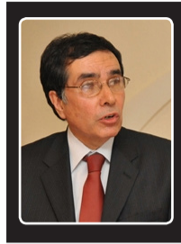
دوکتور ضیا نظام سفير اسبق افغانستان در وينا، بروکسيل و رُم