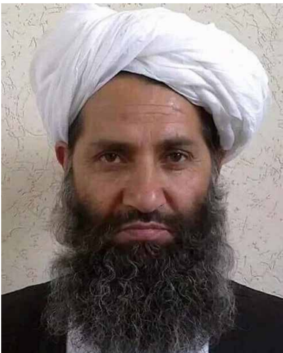
هبت‌الله در مقایسه با منصور

به‌طور کلی، به‌نظر می‌رسد که هبت‌الله رهبر ضعیف‌تری نسبت به منصور است، اما او همچنین می‌تواند چهره‌ی کمتر مناقشه‌برانگیز باشد. منصور یک رهبر قدرتمند و قاطع بود که اگر احساس می‌کرد نیازی به این کار وجود دارد، حاضر به نابودی مخالفان خود بود. اما او همچنین مهارت زیادی در مدیریت اداری و نظامی داشت. ظاهراً هیچ‌کدام از این ویژگی‌ها به‌وضوح در هبت‌الله وجود ندارند، اما با این حال، او به همان اندازه فاقد نقاط ضعف منصور است که او را فردی تفرقه‌افکن ساخته بود.