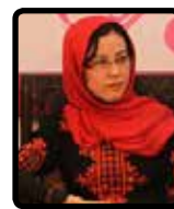
ترجمه: معصومه عرفانی