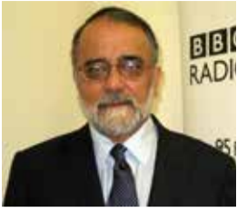
بی بی سی احمد رشید نویسنده و روزنامه‌نگار پاکستانی

احمد رشید، روزنامه‌نگار و نویسنده سرشناس پاکستانی است که مسایل افغانستان را دنبال می‌کند و نویسنده کتاب‌های «طالبان»، «پاکستان در پرتگاه» و «سقوط در هرج و مرج» است. او همچنین مطالب زیادی در خصوص مسایل منطقه منتشر کرده است.