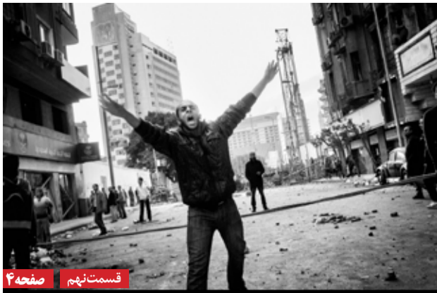
قسمت نهم | صفحه ۴