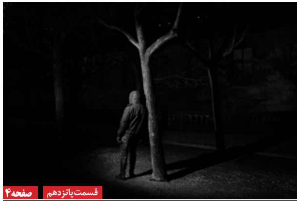
قسمت پانزدهم | صفحه ۴