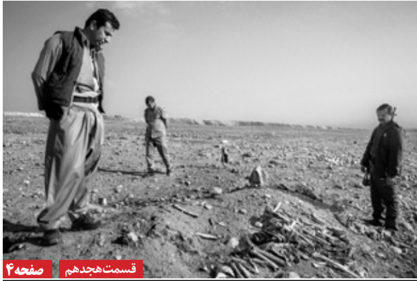
قسمت هجدهم | صفحه ۴