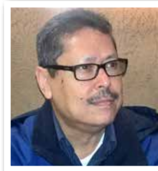
مترجم: غفار صفا