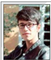
تایمز - اتتونی لوید