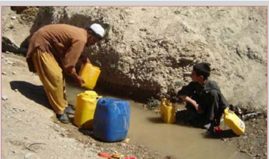
مسئولان در وزارت احیا و انکشاف دهات می‌گویند کار ساخت بند قادرآباد با هزینه ۱۲ میلیون دالر امریکایی از بودجه حکومت افغانستان در ماه حمل سال جاری آغاز شده است - عکس: شبکه‌های اجتماعی

ساخت بند قادرآباد در ولسوالی قادس به مثابه رویا برای باشندگان بادغیس تلقی می‌شود. این رویا در حال عملی شدن است. مسئولان در وزارت احیا و انکشاف دهات می‌گویند که کار ساخت این بند آبی با هزینه ۱۲ میلیون دالر امریکایی از بودجه حکومت افغانستان در ماه حمل سال جاری آغاز شده است. قرار است که این بند طی دوونیم سال آینده به بهره‌برداری برسد.