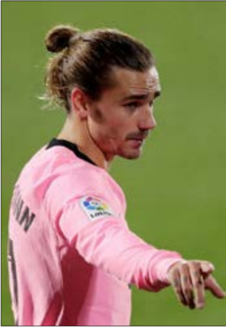
یوونتوس دروازه بان کادرینی با یک گل از کادرینی در دیدار با بارسلونا.

در رئال مادرید پس از شکست شنبه شب برابر کادیز، موجی از نگرانی ایجاد شده است. به نقل از مارکا، نگرانی، واژه ای است که از روز شنبه در