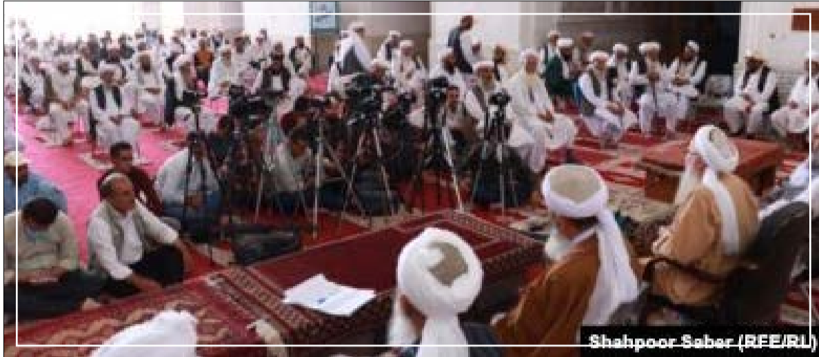
Shahpoor Sabar (RFE/RL)

دوره‌ی تاریخی به بعد روحانیت سر ستیز با دولت‌ها گرفتند و در سدد براندازی دولت‌ها برآمدند. از آن زمان به بعد حضور روحانیت در سپهر عمومی سیاست افغانستان دست آن‌ها را باز کرد تا دولت‌ها را تهدید کرده و در موارد آن‌ها را ساقط کنند.