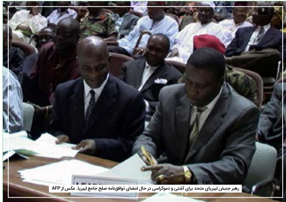
رهبر جنبش لیبریا متحد برای آشتی و دموکراسی در حال امضای توافق‌نامه صلح جامع لیبریا.

با توجه به آنچه در لیبریا اتفاق افتاد، قدرت کیسه پول باید کنترل شود. کسانی که مایل به تهیه بودجه برای مذاکرات هستند نیز تا حد زیادی تعیین می‌کنند که چه کسی و چه تعدادی می‌توانند در آن شرکت کنند.