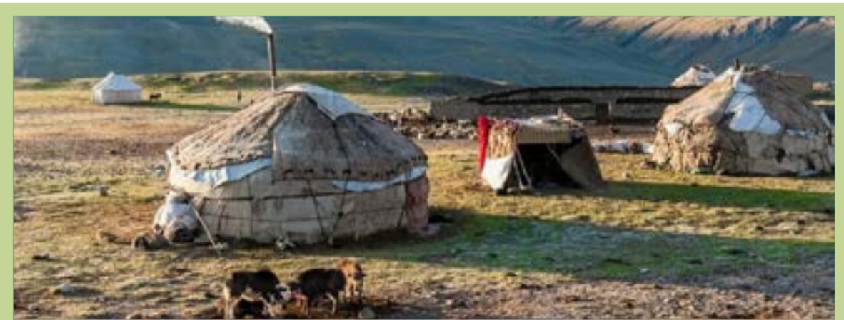
سردی هوا و صعب‌العبور بودن راه‌های ارتباطی، باشندگان واخان را در تنگنا قرار داده است و اغلب این باشندگان در گرسنگی مفرط به زندگی شان ادامه می‌دهند.

ساکنان واخان مدعی‌اند که طی سال گذشته ۱۰۴ تن از ساکنان این ولسوالی به‌دلیل سردی هوا، بیماری و گرسنگی جان داده‌اند. جمعه‌خان آمو، رییس شورای انکشافی ولسوالی واخان در گفت‌وگو با روزنامه اطلاعات روز هشدار می‌دهد که با تداوم بی‌پروایی حکومت مرکزی و محلی، فاجعه انسانی در کمین‌شان است.