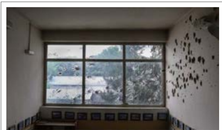
برای‌بهی آمار وزارت داخله افغانستان در این حمله سه مهاجم مسلح نقش داشته که بر اثر آن ۲۴ تن کشته و ۱۶ تن دیگر زخمی شدند.