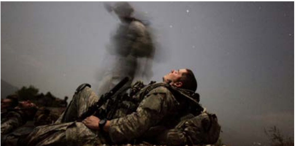
یک سرباز امریکایی در حال استراحت در یک مأموریت شبانه در دره پش، افغانستان

برخی از افغان‌ها از امکان چنین اتفاق می‌ترسند. بسیاری از آن‌ها به گروه بحران