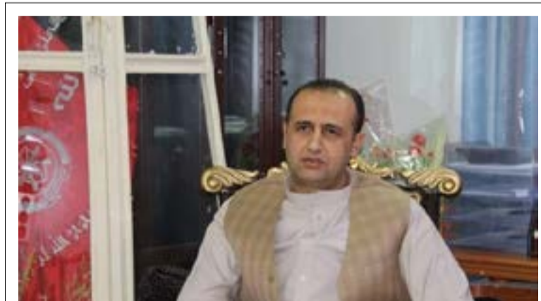
محمدداوود لغمانی به‌تازگی به‌عنوان والی فاریاب معرفی شده است

عنايت‌الله بابر فرهمند، معاون شورای عالی مصالحه‌ی کشور و از اعضای کلیدی حزب جنبش ملی ارگ ریاست‌جمهوری را به