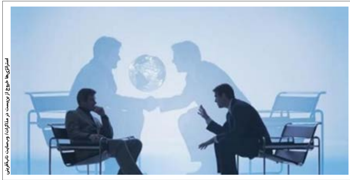
استراتژی‌ها خروج از بن‌بست در مذاکرات و بی‌سببیت تلافی‌فرینی